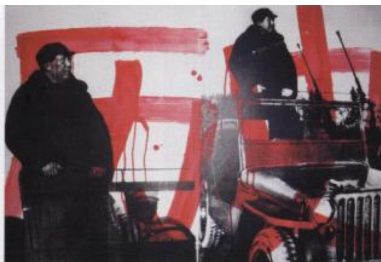
ZHANG DALI History – Second History, 2010