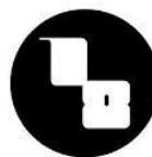
杨泳梁作品《城市山水III》