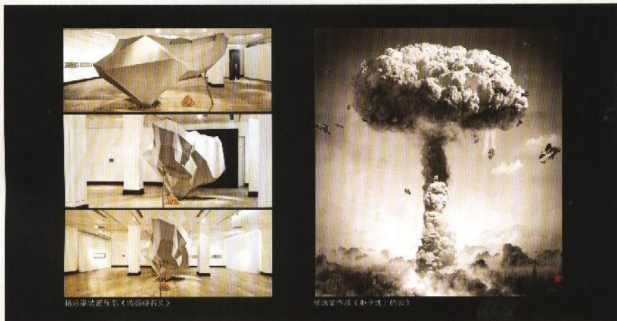
杨泳梁作品《本源记·原石》