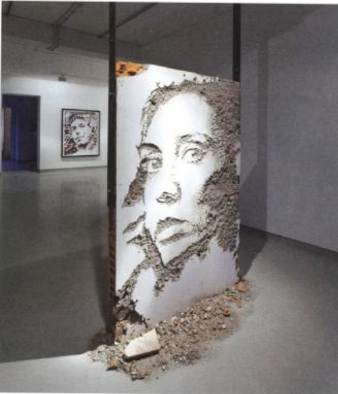
Wall collected from a demolished building | Delirios solo show, Galeria Presenga | Oporto (PT) | 2011