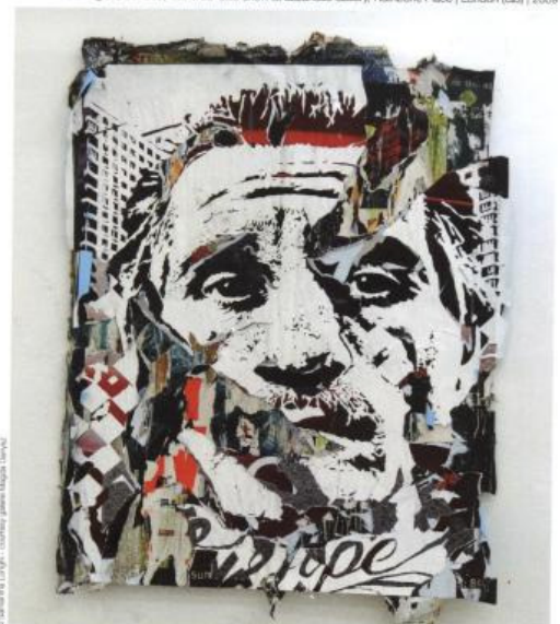
Disposable Utopia Series 10 , spraypaint, acrylic on pasted posters, 168 x 138 cm | 2011