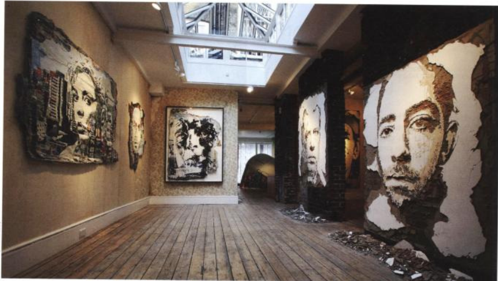
View of Scratching the Surface , first Vhils solo show at Lazarides Gallery, Rathbone Place | London (GB) | 2009