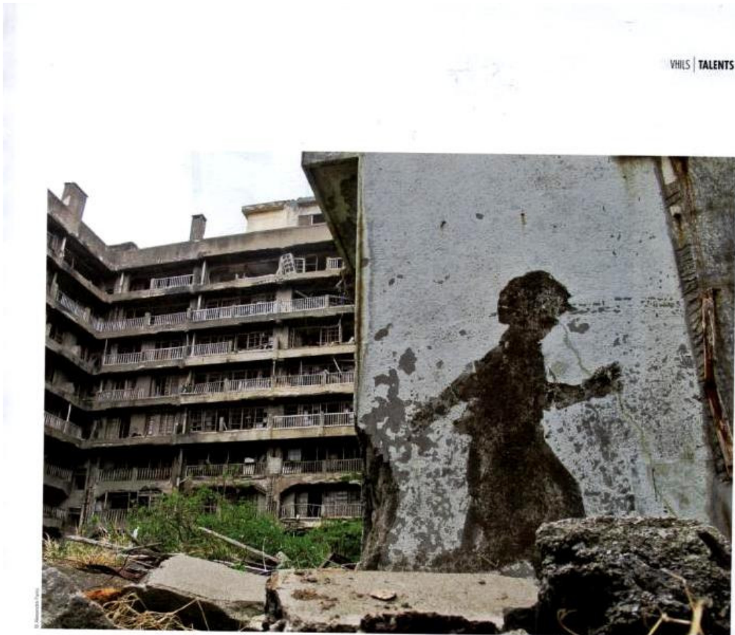
Scratching The Surface project | Haidama, Japan | 2011