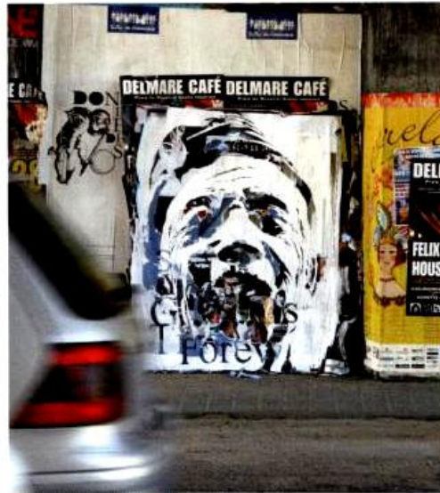
Urho Kivi project | white paint, carved balloons | Serral (PT) | 2007

age 24 location London (GB) / Lisbon (PT) web www.alexandrefarto.com