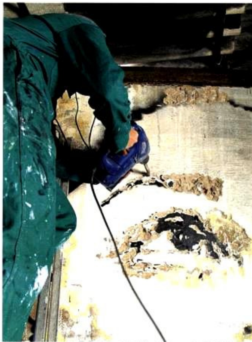
Vhils en action, projet Scratching The Surface , Festival Visual Street Performance, Porto (PT) | 2010

Alexandre Farto alias Vhils est né en 1987 à Lisbonne. C'est à Londres pendant ses études au Saint Martins College of Art and Design qu'il adopte la technique du pochoir dans son travail aux dépens du graffiti. Remarqué par Banksy en 2008, Vhils devient très vite un des plus jeunes talents de la scène street art actuelle. L'été dernier, il participe à la biennale de São Paulo, intervient pour la troisième fois au Fame Festival en Italie, et réalise de nouveaux murs à Berlin et à Cincinnati. Un véritable hyperactif qui vit aujourd'hui entre Londres et Lisbonne.