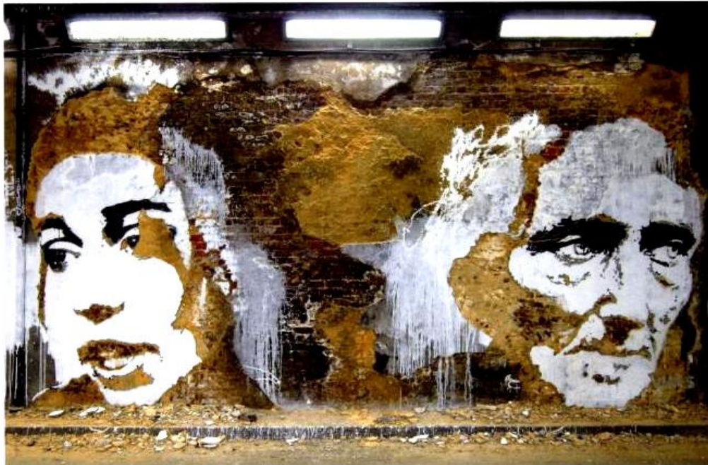
Shakespeare, The Beatles project | Casa Festival | 3 x 4 m | Leake Street, London (GB) | 2008