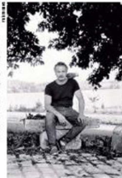
Le chanteur avec le percuteur à l'Empire.