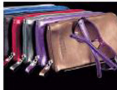
Les branches en cuir de couleur des solaires créés par Stéphane André au prix de 200 € sont coordonnées aux films.