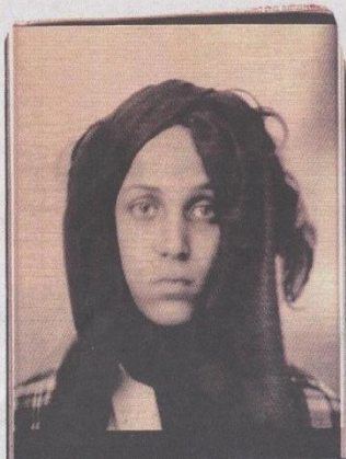
《朱利安·施纳贝尔·宝丽来》一书的封面是朱利安·施纳贝尔对双胞胎儿子中的Oimo，穿脏的脸被盖在了头巾下，朱利安说像一个摩洛哥村姑。