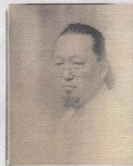
施纳贝尔眼里，村上隆是个“空心男孩”，又结实又脆弱。“不过我总觉得他应该有更深邃的一面，是我不可能触及的。”施纳贝尔坦言。