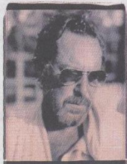
朱利安·施纳贝尔的自拍照