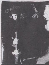
地下丝绒乐队的Lou Reed就住在施纳贝尔的家对面，关系像家人一样亲密。这张照片中，Lou Reed手持宝剑，像是站在野兽之舞的边缘，被施纳贝尔称为“就像埃斯科菲埃电影中的安德烈·卢布罗夫”。